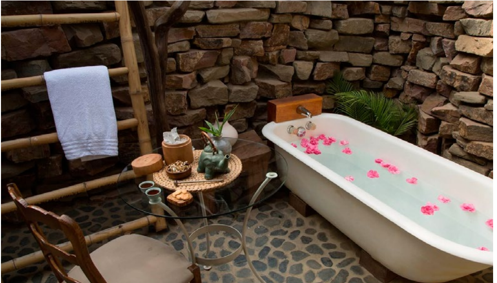
AMAVEDA EN KICHIC Piura, Perú